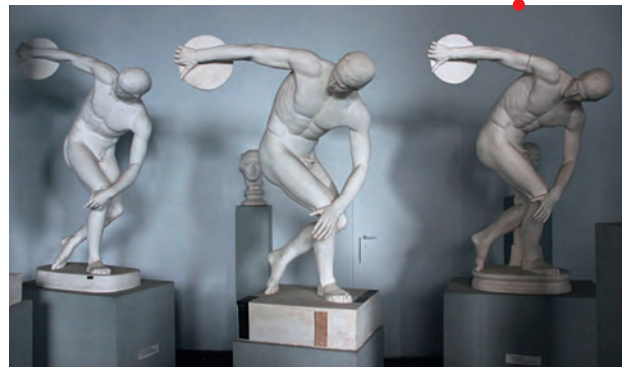
Moulages du Discobole de Myron, Université de la Sapienza, Rome.

Le sport naît en Grèce dans le courant du VI e siècle av. J.-C. Apparaissent alors les premiers stades et les premiers gymnases, se constitue le premier calendrier de compétitions sportives, se systématisent la pratique de la nudité athlétique. Mais le VI e s. voit, d'abord et avant tout, surgir une figure nouvelle dans le paysage social des cités grecques : l'athlète, individu qui consacre l'essentiel de son temps à l'entraînement et à la compétition. À travers le portrait du plus célèbre des athlètes de l'Antiquité, le lutteur multiple champion olympique Milon de Crotonne, on découvrira les conditions de naissance de la première culture sportive de l'histoire, mais aussi le quotidien des anciens sportifs, entre exercice, règles diététiques et voyages vers les sites des grands concours ? Comment se construisent les palmarès ? Quelle valeur accorde-t-on à la victoire sportive ? Comment honore-t-on les athlètes ? Quels exploits prête-t-on aux champions et quelles légendes entourent leur existence ? Dans quelle mesure cette première forme du sport peut-elle être pensée comme un avatar de la guerre ?