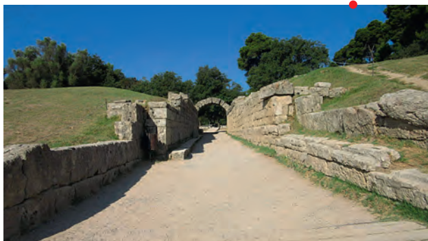
Olympie (Grèce), l'entrée du stade antique.

Conférence en partenariat avec l'association Guillaume-Budé