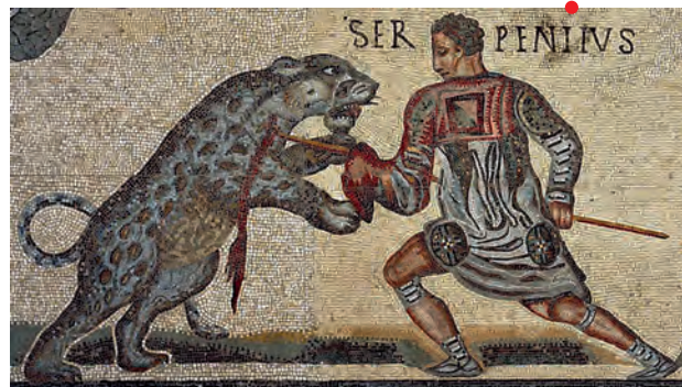
Mosaïque des Gladiateurs, villa Borghèse, Rome. Détail.

À partir du II e siècle av. J.-C., l'activité ludique de la chasse se développe à Rome. La passion pour cette activité culmine aux trois premiers siècles de l'Empire et sa transposition dans les spectacles de l'amphithéâtre en sont l'expression la plus aboutie. Les chasses amphithéâtrales ( venationes ) sont ainsi parfois plus populaires que les combats de gladiateurs, comme en Afrique.