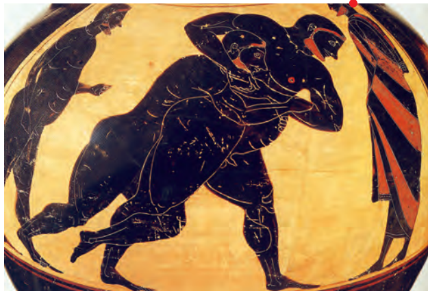
Scène de lutte amphore panathénaïque de la première époque (566-530 av. J.-C.), Badisches Landesmuseum Karlsruhe, 65/45.

Le sport naît en Grèce dans le courant du VI e siècle av. J.-C. Apparaissent alors les premiers stades et les premiers gymnases, se constitue le premier calendrier de compétitions sportives, se systématisent la pratique de la nudité athlétique. Mais le VI e s. voit, d'abord et avant tout, surgir une figure nouvelle dans le paysage social des cités grecques : l'athlète, individu qui consacre l'essentiel de son temps à l'entraînement et à la compétition. À travers le portrait du plus célèbre des athlètes de l'Antiquité, le lutteur multiple champion olympique Milon de Crotonne, on découvrira les conditions de naissance de la première culture sportive de l'histoire, mais aussi le quotidien des anciens sportifs, entre exercice, règles diététiques et voyages vers les sites des grands concours ? Comment se construisent les palmarès ? Quelle valeur accorde-t-on à la victoire sportive ? Comment honore-t-on les athlètes ? Quels exploits prête-t-on aux champions et quelles légendes entourent leur existence ? Dans quelle mesure cette première forme du sport peut-elle être pensée comme un avatar de la guerre ?