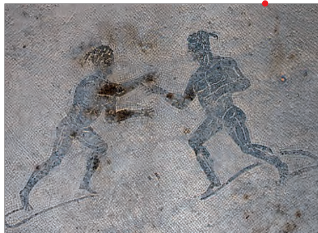
Mosaïque du I er s. apr. J.-C. représentant des athlètes aux prises, Pompéi (VIII, 2, 3).

Les thermes, au-delà d'une installation consacrée au nettoyage des corps, sont une institution essentielle à la vie quotidienne et civique des communautés du monde romain. Leur caractère public suppose qu'on y suit un certain nombre de comportements que nous aurions tendance à restreindre à la sphère privée. De plus, les soins du corps doivent y être pris dans un sens plus large et nombre d'auteurs insistent sur leur encadrement au sein d'une réflexion globale. Les activités sportives sont incluses dans ces raisonnements, à la fois moraux, médicaux et civiques. Nous allons donc les examiner, autant dans leurs modalités que dans les attentes auxquelles elles sont censées répondre.