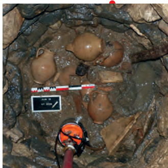
Le puits de l'Auribelle en cours de fouille.

Depuis le XIX e s., la fouille de puits d'époque romaine, dans le territoire de l'ancienne Gaule, a livré une documentation matérielle exceptionnelle et révèle de précieuses informations sur la vie quotidienne ou des pratiques magico-religieuses insoupçonnées. Les puits, en effet, constituent souvent les réceptacles privilégiés de rejets domestiques et occupaient aussi, dans l'imaginaire collectif, un rôle central, permettant d'entrer en contact avec les divinités du sous-sol. Scellés par de la terre et soumis à une humidité constante, ils constituent des milieux particulièrement propices à la conservation des matières organiques ce qui explique leur grand intérêt scientifique.