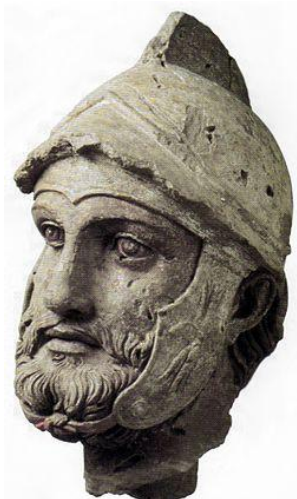
Guerrier parthe Nisa (Turkménistan) II e -I er s. av.